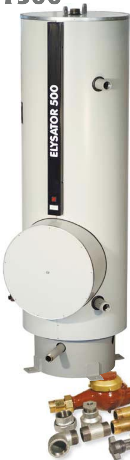
Kopplingsdelar till Elysator T500