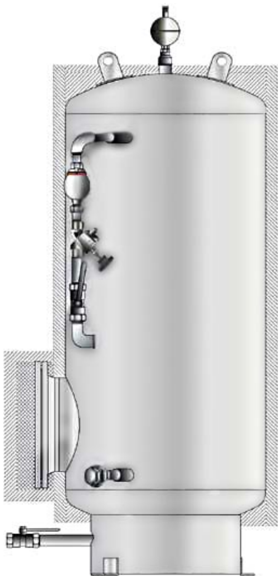
Kopplingsdelar till Elysator T1000