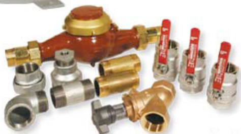
Kopplingsdelar till Elysator 800